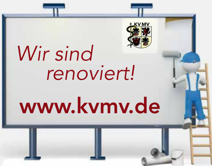
Neuer KVMV-Internetauftritt seit 1. März 2019