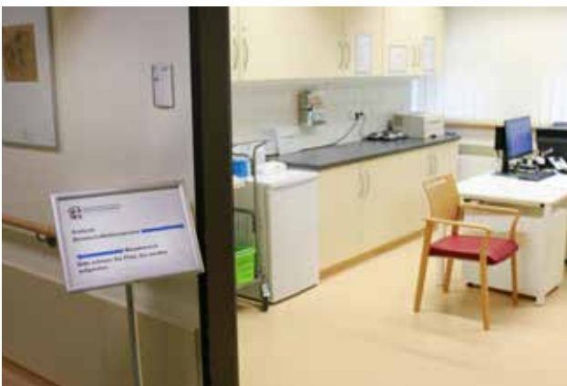
Bereitschaftsdienstpraxis Neustrelitz

Im Zuge der landesweiten Bereichsveränderungen im ärztlichen Bereitschaftsdienst der KVMV kam es in den Dienstbereichen Hagenow, Neustrelitz, Pasewalk und Waren zur Einrichtung weiterer Bereitschaftsdienstpraxen. Mittlerweile unterhält die KVMV insgesamt dreizehn allgemeine und zwei pädiatrische Bereitschaftsdienstpraxen. Diese stellen in einem Einzugsbereich von etwa 30 Kilometern und teilweise darüber hinaus die ambulante Versorgung außerhalb der regulären Sprechstunden zu näher festgelegten Öffnungszeiten für jene Patienten sicher, die keines Hausbesuchs bedürfen und somit selbst die Praxis aufsuchen können.