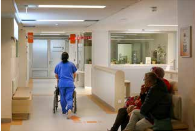
Vor der Bereitschaftsdienstpraxis im Klinikum Südstadt Rostock

März 2024, Seiten 4-5), bei denen Umbaumaßnahmen beabsichtigt sind bzw. waren, räumten der KVMV ein Mitspracherecht bei der Raumplanung und Raumgestaltung ihrer Bereitschaftsdienstpraxis ein. Dadurch ist es möglich, noch genauer auf die Bedürfnisse der Ärzte und Patienten eingehen zu können.