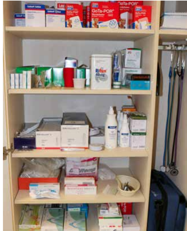
Sprechstundenbedarf; Foto: © KVMV/Müller

Die formalen Vorgaben (Packungsgröße N1; Kennzeichnung „Bereitschaftsdienstbedarf“) bleiben unverändert gültig und prüfrelevant.