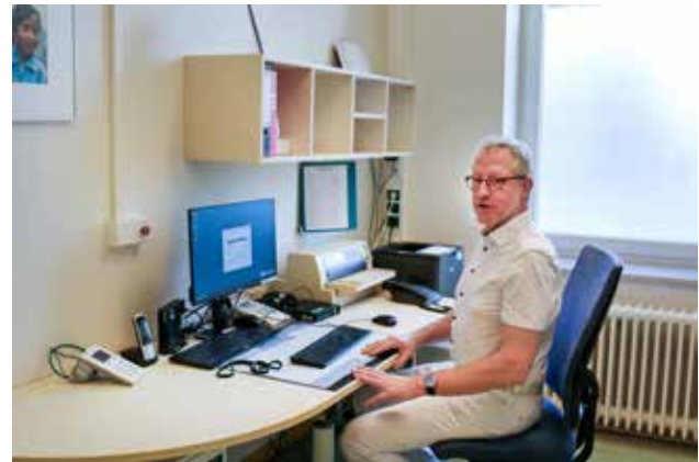
Bereitschaftsdienstpraxis Parchim

und die aufwändige Suche nach der richtigen Adresse des Patienten werden vermieden. Gerade in größeren Dienstbereichen wird eine Bereitschaftsdienstpraxis als sinnvolle Entlastung des Fahrdienstes erachtet, da geh- bzw. transportfähige Patienten auf diese verwiesen werden können. Im Sinne einer gleichmäßigen und gerechten Beteiligung am Bereitschaftsdienst können darüber hinaus auch Ärzte einbezogen werden, die sich zwar nicht mehr zum Fahrdienst in der Lage sehen, aber „Sitzdienste“ in einer Bereitschaftsdienstpraxis durchführen können.