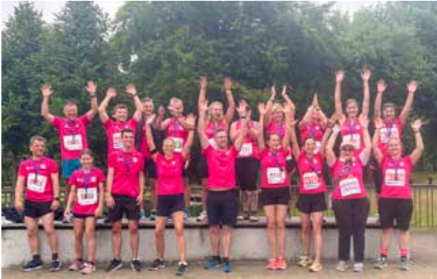
Die KVMV war 2025 mit 23 Teilnehmenden dabei; Foto: © KVMV