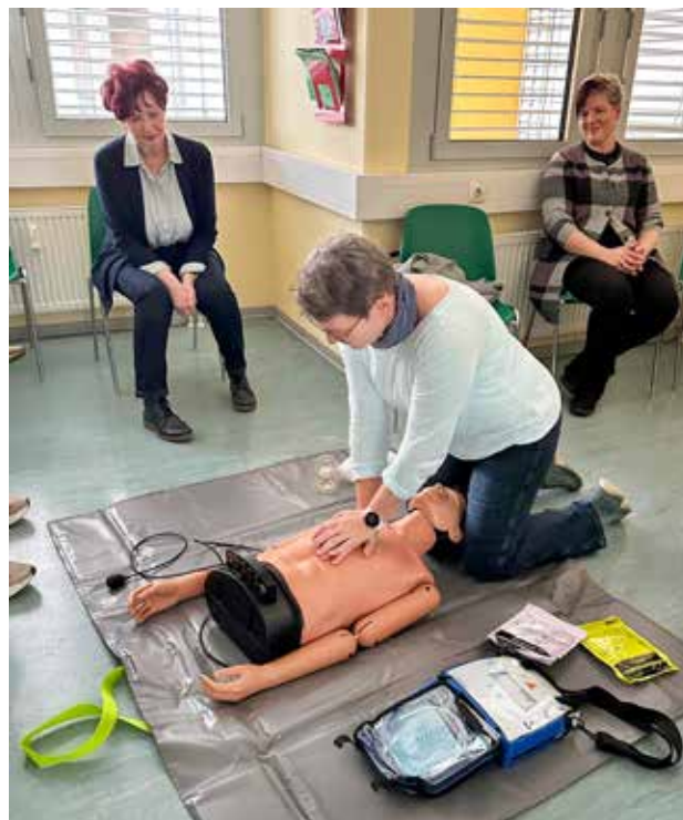
Notfallseminar; Foto: © Torsten Lange

Das Seminar wurde von allen Beteiligten als sehr lehrreich und praxisorientiert erlebt. Neben der fachlichen Auffrischung trug es auch spürbar zur Stärkung des Teamgeistes in der Praxis und zu mehr Sicherheit im Notfallalltag bei. Künftig sollen ähnliche Trainings in regelmäßigen Abständen durch die Kreisstelle Rostock angeboten werden, um Wissen und Routine im Notfallmanagement dauerhaft auf einem hohen Niveau zu halten. ■